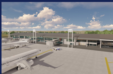
Terminal pasajeros Aeródromo Cañal Bajo Osorno