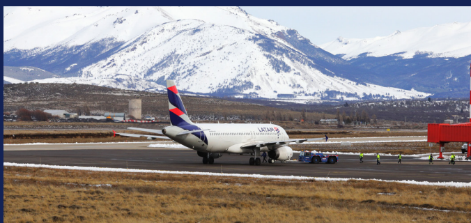
Normalización área movimiento Aeródromo Balmaceda