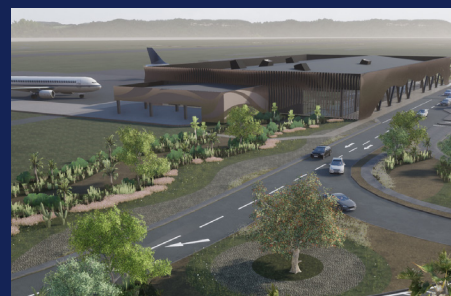
Terminal pasajeros Aeropuerto Viña del Mar