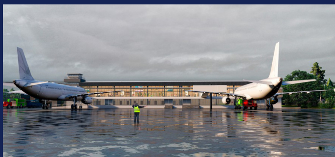
Terminal pasajeros Aeródromo Pichoy Valdivia